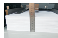
Epaisseur de papier : 90 mm